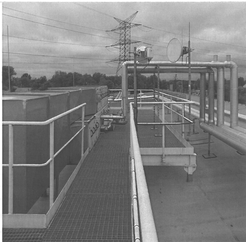
Fot. 1. OM Radzymin / ul. Polna 21 – widok anteny linii radiowej Emitel na dachu budynku